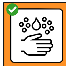
Se laver soigneusement les mains