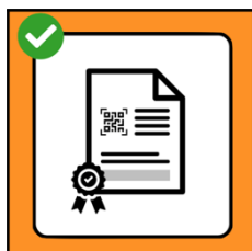
Le certificat COVID est obligatoire